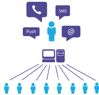
Sistema VIPER MASS